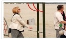
Impresja: Gdynia przed burzą (1 komentarzy)

Sukces! Teatr Miejski i Teatr Muzyczny okiem Jacka Sieradzkiego (1 komentarzy) Papień polskiej krytyki teatralnej ocenia gdynskie spektakle Czytaj całość