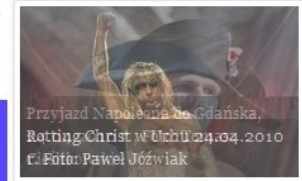
Przyjazd Napoleona do Gdańska, Rotting Christ w Uchu 24.04.2010